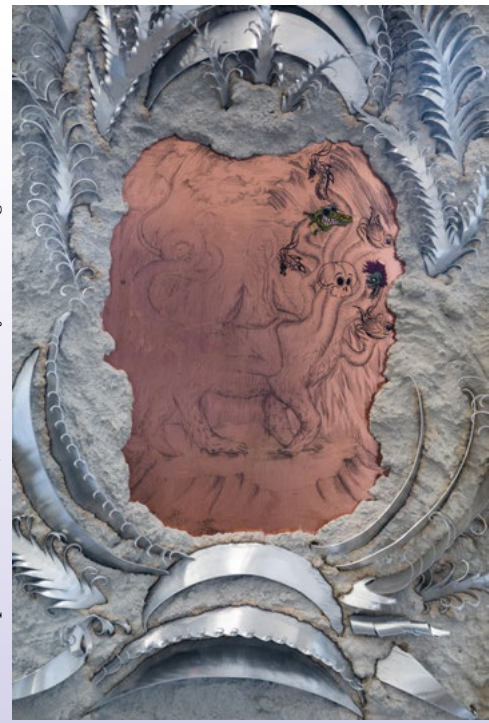
Anastasia Sosunova: Relic II, 2021 (Detail). Kupfer, Beton, Aluminium, Aufkleber. / Copper, concrete, aluminium, stickers. Swallow, Vilnius. Ausstellungskuratorin/Exhibition curator: Vaida Stepanovaite.